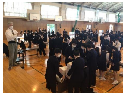
* 2022 年 4 月 8 日 学校法人暁学園暁中学高等学校防災と人権の学習会の様子