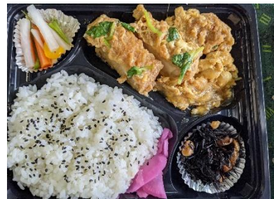
* 日本トランスシティ×ワークセンターれすと 共同実施した防災備蓄食を有効活用したサスティナブル弁当