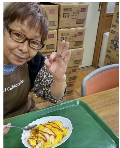
* ワークセンターれすと（多摩市）でのアルファ化米のリメイク料理